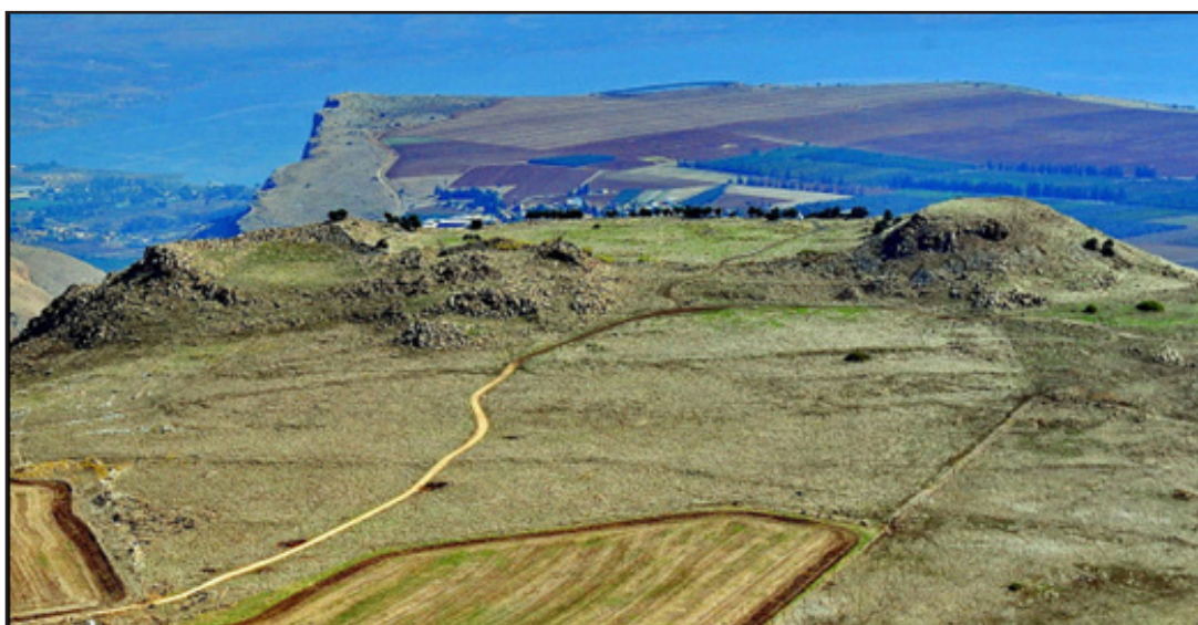
איור 8: נוף אסוציאטיבי עם שרידים בשטח (המבצר הצלבני) - קרני חיטין, סיפור הקרב בין הצלבנים למוסלמים

סוג נוסף של נופי מורשת הם נופים אסוציאטיביים . לרוב הם נופים טבעיים, ולעיתים בשטחים מיושבים, המקיימים אסוציאציות דתיות, היסטוריות, אמנותיות או תרבותיות בעלות עוצמה, גם כאשר לא מצויים בהם שרידים משמעותיים לפעילות אנושית. נוף אסוציאטיבי מזוהה באופנים רבים. הוא יכול להיות אתר מפורסם דוגמת הכותל המערבי או מצדה; הוא יכול להיות בעל חשיבות אישית, דוגמת גן שעשועים שהפרט בילה בו עם הוריו בילדותו, או המקום שחווה בו את הנשיקה הראשונה. מכלול של תכונות אישיות וידע אישי מכתיבים במידה רבה את היווצרותם של נופים האלה. הנופים עשויים להתהוות גם כאשר מצויים בשטח שרידים פיזיים הקשורים לאירוע מסוים, למשל הדוגמא המוצגת באיור 8, וגם כאשר לא נותר בשטח כל שריד פיזי, למשל הדוגמא המוצגת באיור 9.