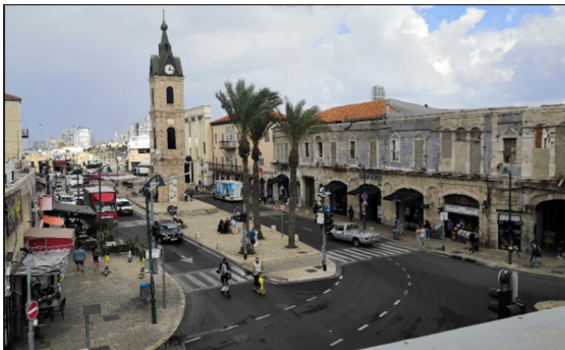
איור 4: נוף עירוני-היסטורי: כיכר השעון ביפו

נופי מורשת התרבות המוחשית הנפוצים יותר באזורים העירוניים הם הנופים העירוניים-היסטוריים. אלה מכלולים של מבנים ובניינים שנוצרו במהלך ההיסטוריה המקומית. מכלולים אלה הם מרקמים עירוניים שנדבכיהם התרבותיים והטבעיים אינם מוגבלים לתיחום הגרעין ההיסטורי או לתיחום המוניציפאלי העירוני. דוגמאות לנופים אלה מוצגים באיורים 4 ו-5.