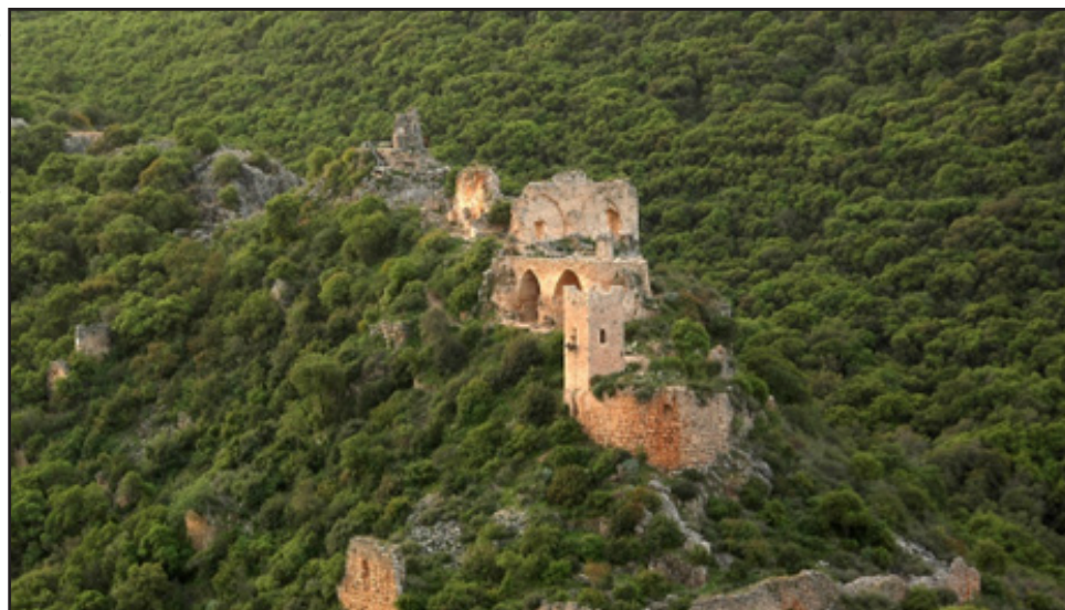
איור 10: מבצר המונפורט המוכרז כגן לאומי בתוך שמורת הטבע נחל כזיב

אתרים היסטוריים בסביבה העירונית יוצרים מתחמי בילוי, תרבות ותיירות ומוסיפים נדבך נוסף לרבדים המבוניים של היישוב. בכך הם תורמים לכלכלת הרשות המוניציפלית בה הם מצויים. דוגמא למתחם בילוי ותרבות שהתפתח סביב שני בניינים היסטוריים סמוכים הוא מרכז סוזן דלל המוצג באיורים 11 ו-12 ומדגים את השימוש המגוון של הבניינים והרחבה סביבם.