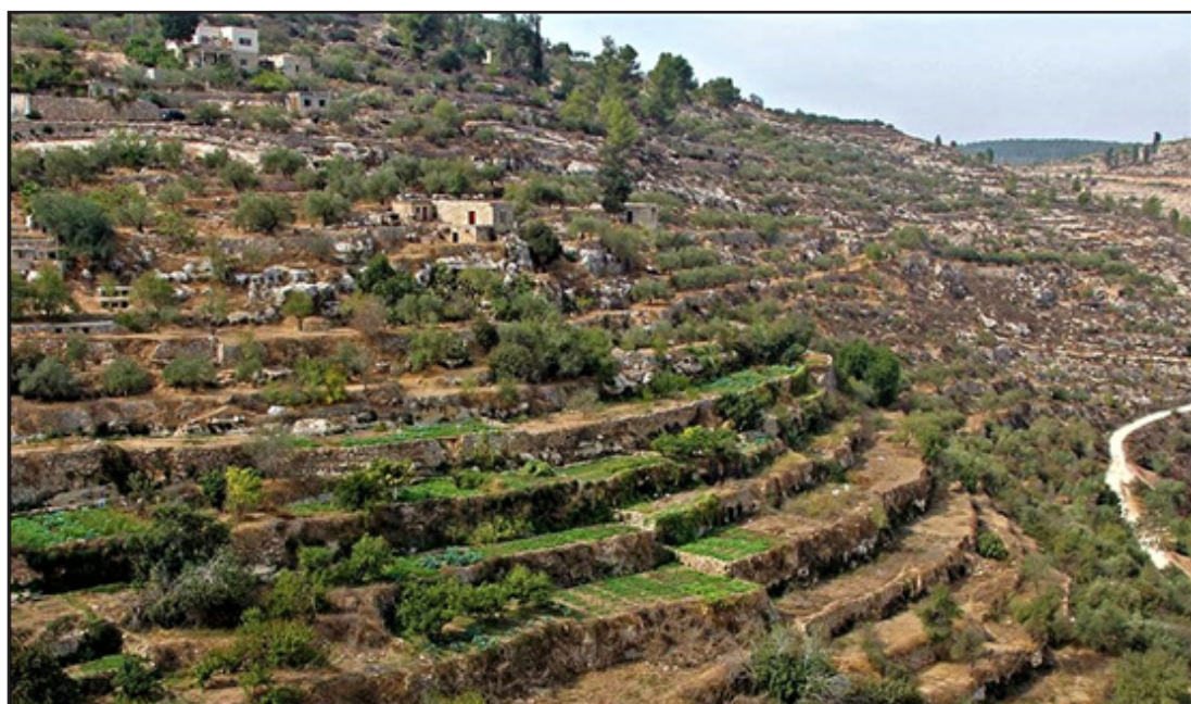
איור 3: נוף תרבות חקלאית: הטרסות החקלאיות ליד הכפר בתיר, הרי יהודה