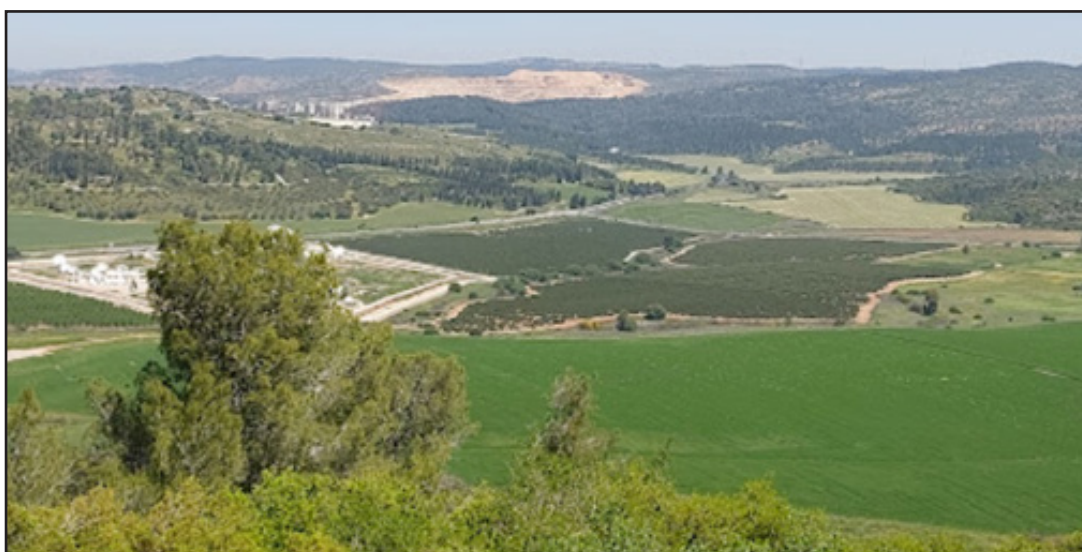
איור 9: נוף אסוציאטיבי ללא שרידים פיזיים בשטח - עמק האלה, מלחמת דוד וגוליית