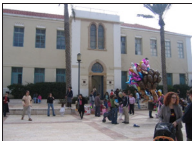
איור 12: בניין בית הספר הישן (1908) לבנות, שהפך למוקד תיאטרון ולפעילות תרבותית מגוונת

אתרים היסטוריים בסביבה העירונית יוצרים מתחמי בילוי, תרבות ותיירות ומוסיפים נדבך נוסף לרבדים המבוניים של היישוב. בכך הם תורמים לכלכלת הרשות המוניציפלית בה הם מצויים. דוגמא למתחם בילוי ותרבות שהתפתח סביב שני בניינים היסטוריים סמוכים הוא מרכז סוזן דלל המוצג באיורים 11 ו-12 ומדגים את השימוש המגוון של הבניינים והרחבה סביבם.