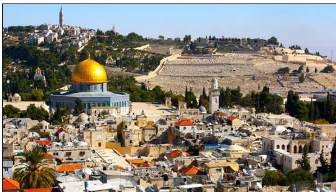
איור 5: נוף עירוני-היסטורי: העיר העתיקה והר הזיתים, ירושלים