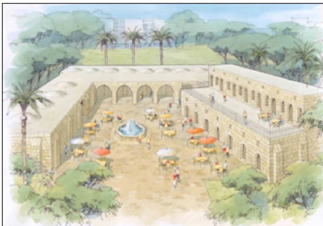
איור 14: תוכנית רעיונית לשימור ולהפעלת ח'אן אל-חילו להסעדה ולתיירות