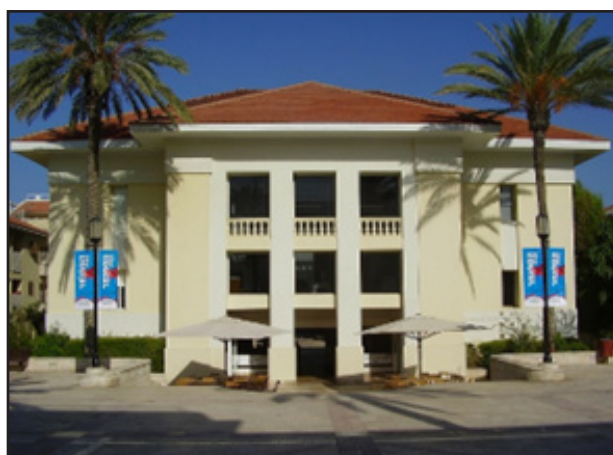
איור 11: בניין בית הספר הישן (1908) לבנים, שהפך בית לשלוש להקות מחול ומרכז לכנסים