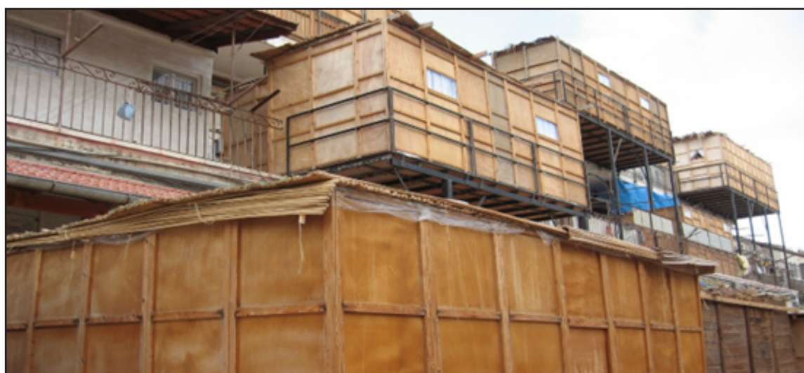
איור 7: נוף מורשת עיתי עירוני הנוצר בתקופת חג הסוכות בבני ברק