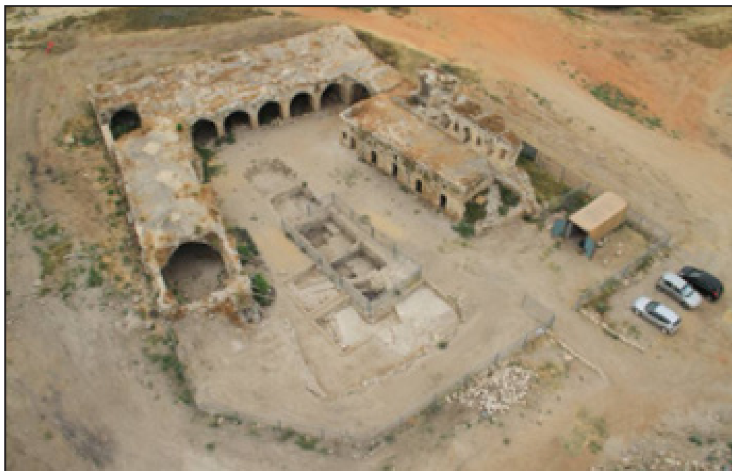
איור 13: שרידי ח'אן אל-חילו העותמאני בלוד

ישנם גם מבני מורשת היסטוריים שלא זכו עדיין לשימור אך הם זכו כבר לתכנון רעיוני שישפיע על הסביבה העירונית ודרך פיתוחה. דוגמא אחת לכך היא ח'אן אל-חילו בלוד שאת סביבתו ניקו לאחרונה והוא ממתין לתקציבי הפיתוח והשימור (ראה איורים 13 ו-14).