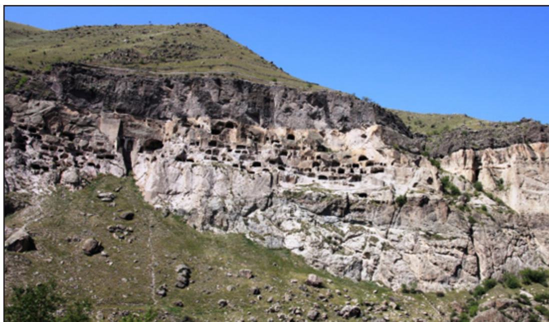
איור 2: נוף תרבות אורגני: ורדזיה, גיאורגיה - עיר המערות החצובות בהר

על פי האמנה להגנת המורשת העולמית של אונסקו (1972), נוף תרבות הוא נוף המייצג את "היצירה המשולבת של אדם וטבע". קיימת הבחנה בין נוף תרבות מעוצב - נוף שתוכנן ונוצר בידי אדם (למשל, הגנים הבהאים בחיפה ובעכו), לבין נוף תרבות אורגני - נוף המייצג תרבות, מסורת ואורחות חיים שהתפתחו באופן אורגני. להלן שתי דוגמאות לנוף תרבות אורגני (איורים 2 ו-3).