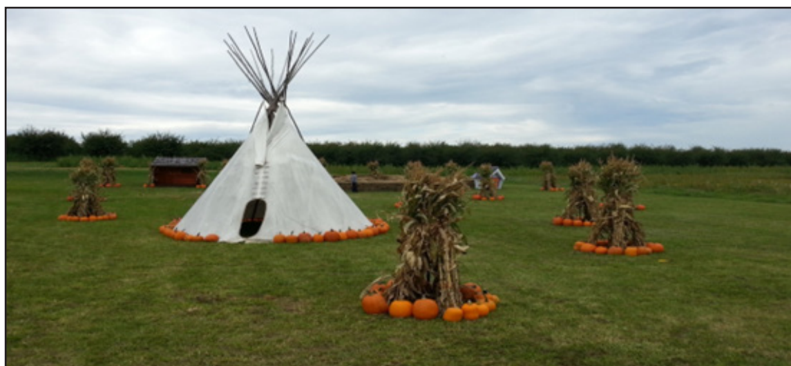
איור 6: נוף מורשת עיתי הנוצר במרחב הכפרי בתקופת "חג כל הקדושים" בצפון אמריקה

בנוסף לנופים הנוצרים על ידי נכסי מורשת תרבות מוחשית, ישנם נופים הנוצרים על ידי נכסי מורשת תרבות לא מוחשית שיש להם ביטוי בנוף, הן בנוף הבנוי והן בנוף הפתוח. נופים אלה הם ארעיים ברוב המקרים כיוון שהם קשורים לאירועים ומנהגים דתיים, למסורות של קרנבלים ומצעדים, לאירועי תרבות שונים ופסטיבלים הנהוגים במקום, וכיוצא בזה. ככלל, נהוג לכנותם נופי תרבות עיתיים . דהיינו, כאלה הנוצרים מעת לעת. דוגמאות לנופים אלה מוצגים באיורים 6 ו-7.