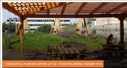
סיור מקצועי | משחק ופדגוגיה - בנייה, צמיחה והרמוניה בבית הספר