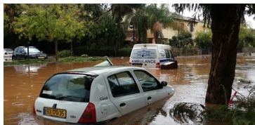
הצפות בכפר סבא בחורף שעבר

כשהסתיו הקיצי מורגש כעת בישראל, העין מופנית לוועידת האקלים העולמית בגלאזגו, סקוטלנד. שם, מתכנסים פוליטיקאים ומשלחות מ"מ מטעמן של יותר מ-190 מדינות, כדי להגיע להסכמות בנוגע להפחתת פליטות וטיפול בסוגיות משבר האקלים. לעת עתה, אין בשורה ממשית משדרת המנהיגות הבינלאומית, וההכנות שסיפקו הפוליטיקאים - נותרו דלות למדי. והמציאות? היא נעה דווקא בקצב המודל אותו מציג ד"ר הוכמן. סקרנים לדעת מה עתיד לבוא? כנסו לכתבה