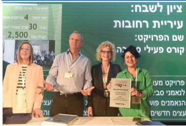
רחובות זוכת אות העירוניות ועידת עכו לעירוניות

במסגרת ועידת עכו לעירוניות, שהתקיימה ב-18-19.10.21, ביוזמת הפורום הישראלי לעירוניות, הוענק "אות העירוניות" לרשויות שהציגו מיזמים פורצי דרך ובעלי ערך מוסף שמטרתם חיזוק החוסן העירוני לנוכח משבר הקורונה ומשבר האקלים. בקטגוריית ' שיפור ההתמודדות עם משבר האקלים' זכתה עיריית תל אביב-יפו במקום הראשון על "תכנית היער העירוני"; במקום השני הגיעה עיריית גבעתיים על מיזם "הצללת המרחב העירוני". במקום השלישי זכתה עיריית טירת הכרמל על פרויקט "הבניין הירוק". עיריית רחובות קיבלה ציון לשבח על פרויקט "קורס פעילי סביבה". נציין גם שעיריית ירושלים זכתה במקום הראשון בקטגוריית שיפור העמידות הקהילתית והכלכלית נוכח משבר הקורונה.