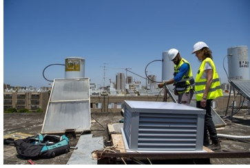
ראשי רשויות תמר, ירוחם וערד.