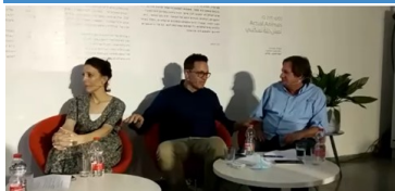
ראשי רשויות תמר, ירוחם וערד.