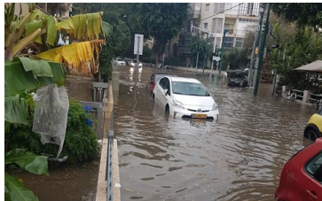
הצפות ליד העירייה, בצומת שד' בן-גוריון ורחוב אדם הכהן