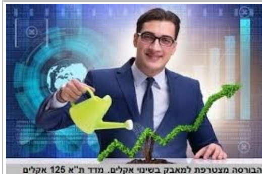
הבורסה מצטרפת למאבק בשינוי אקלים. מדד ת"א 125 אקלים