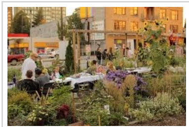
חוסן עירוני – מסמך לרשויות המקומיות