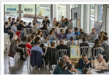
המלצות לתהליכי שיתוף בשלטון המקומי