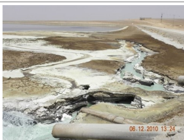
זיהום נחל אשלים *התאריך בתמונה – טעות.