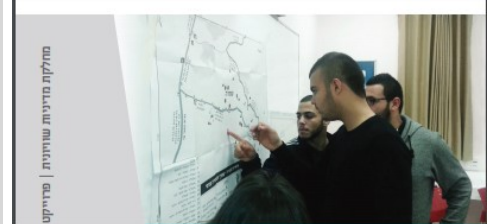
מחלקת מדיניות שווייט | פרויקט תחבורה ציבורית

חברת זו המכילה סקירה של פעילות המשרד להגנת הסביבה מול הרשויות המקומיות על פי חלוקה לאגפים המקצועיים. נוסף על כך, שולבה